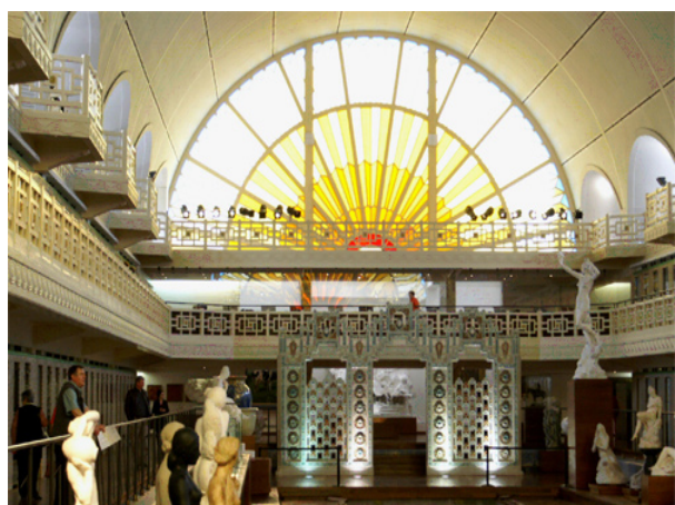
Musée d'Art et d'Industrie de Roubaix

Cette région du Nord, au riche patrimoine, mérite d'être connue.