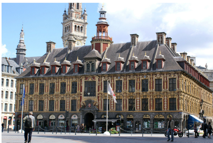
La Grand'Place de Lille