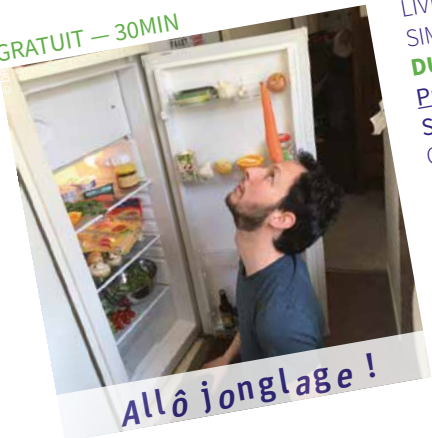
Allô jonglage !

LIVRAISON DE JONGLAGE À DOMICILE SUR SIMPLE COMMANDE DU 22 AU 25 SEPTEMBRE Première intention Sur l'ensemble de l'agglomération Comme on commanderait une pizza, ici, c'est un spectacle jonglé que vous vous ferez livrer. Appelez au 07 53 72 76 71, et recevez, avec vos amis ou vos voisins, nos artistes pour un temps de jonglage. Quel que soit votre espace, on s'adapte, rien que pour vous ! Ouverture des réservations le mercredi 14 septembre.