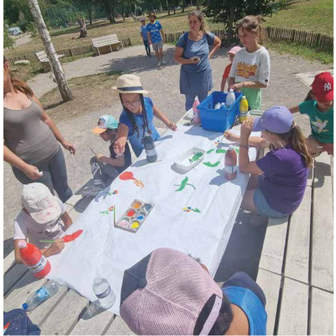
Journée intercentre, entre le PAJ et l'ALSH, au city-stade.