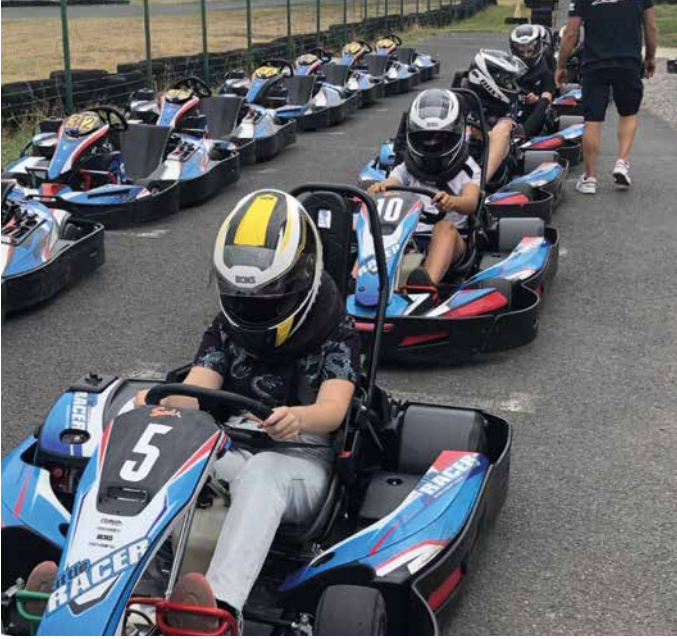
Sortie karting avec le Point Accueil Jeunes