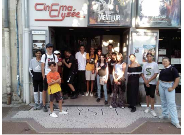
Sortie au cinéma de Chantilly pour les ados !