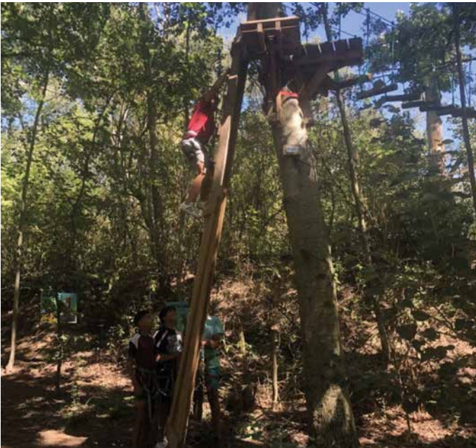
Les jeunes à l'accrobranche, lors de leur séjour à Saint-Sauveur.