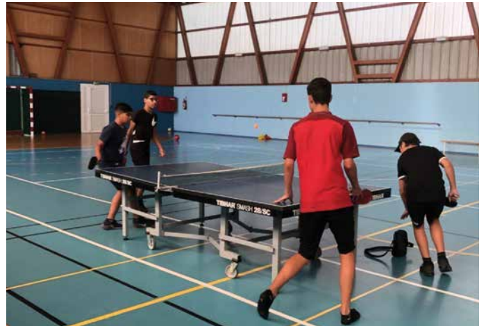
Ping Pong au gymnase !

Des jobs d'été au service de la ville ! Entre le 4 juillet et le 31 août, 23 jeunes ont été accueillis dans les services de la mairie afin d'effectuer un job d'été. Répartis dans différents services, ils ont, pour certains, pu découvrir le monde du travail.